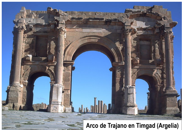
Arco de Trajano en Timgad (Argelia)