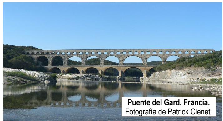
Puente del Gard, Francia.

Ayudándote de la descripción del texto, de la ilustración que lo acompaña y del material visual que desees, dibuja el esquema de una ciudad romana ideal, colocando e identificando en ella los edificios públicos y equipamientos habituales.