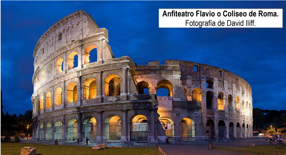
Anfiteatro Flavio o Coliseo de Roma.

Las ciudades romanas cuentan normalmente con abastecimiento de agua potable, por medio de extensos acueductos , y alcantarillado . Los romanos desarrollan también otras importantes obras de ingeniería, tales como puentes , faros y calzadas . Además, suelen levantarse edificios públicos destinados al ocio y recreo de la población.