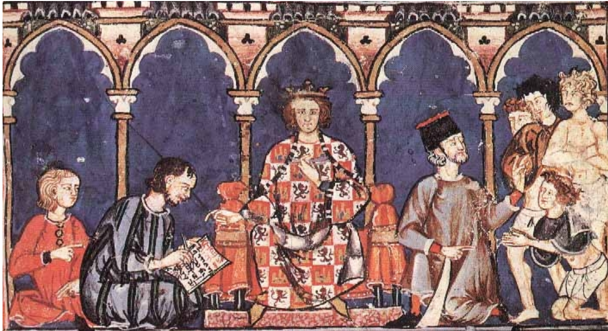
Escuela de Traductores de Toledo

* A partir de sus conocimientos y del material adjunto desarrolle el tema: La Península Ibérica en la Edad Media: los reinos cristianos (siglos VIII al XIII) (Origen y evolución de los primeros núcleos cristianos de resistencia. El nacimiento de León y Castilla / Expansión y formas de ocupación del territorio. Modelos de repoblación y organización social. La Mesta / Las tres culturas peninsulares). Valoración máxima: 6 puntos.