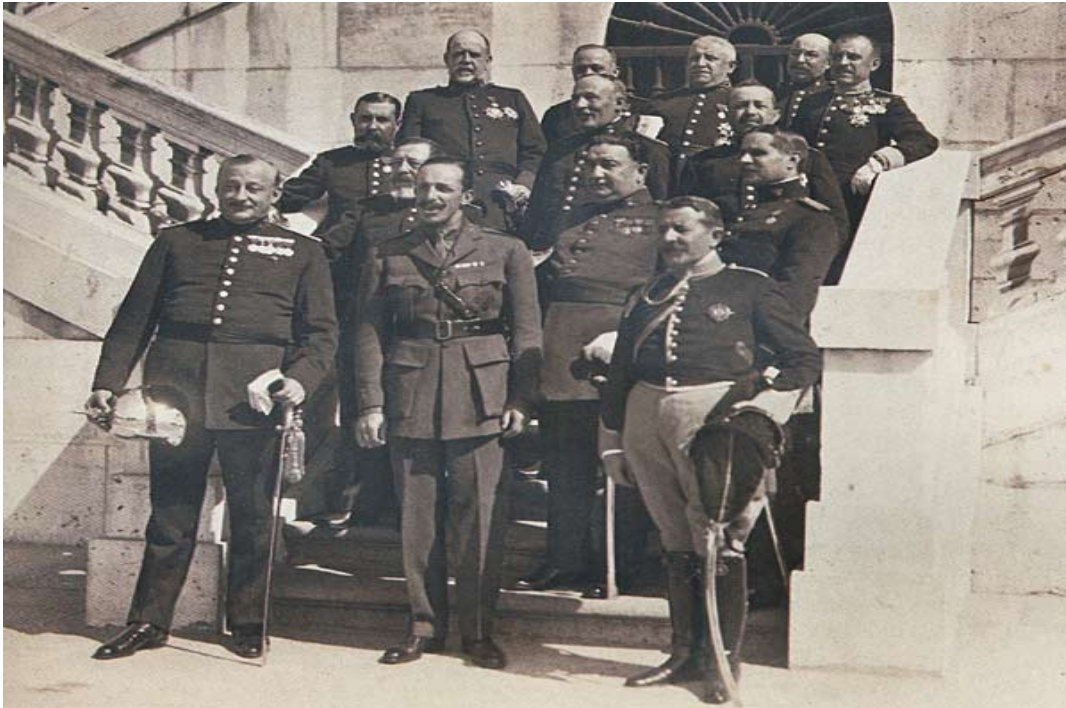
Alfonso XIII y Primo de Rivera con los ministros del Directorio Militar

* A partir de sus conocimientos y del material adjunto desarrolle el tema: El reinado de Alfonso XIII: la crisis de la Restauración (1902-1931) (Intentos de modernización. Regeneracionismo y revisionismo / La quiebra del sistema: conflictividad social y crisis de 1909, 1917 y 1921 / La Dictadura de Primo de Rivera). Valoración máxima: 6 puntos.