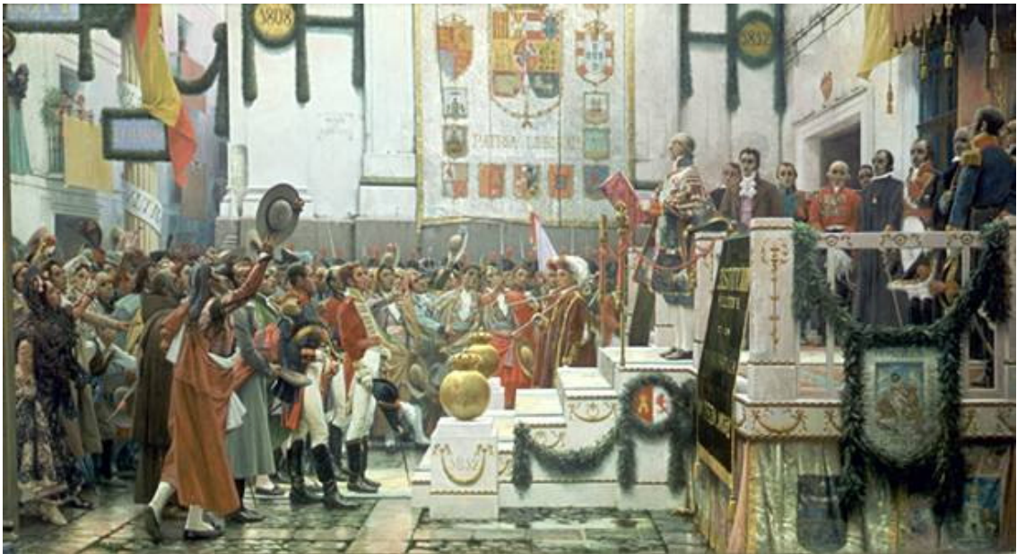
Proclamación de la Constitución de Cádiz, por Salvador Viniegra

* A partir de sus conocimientos y de los materiales adjuntos, desarrolle el tema :